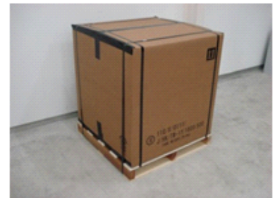
バンド掛けと梱包仕上がり状況

パレットとケース本体を19mm幅のエステルバンド(PET)で4本#字掛けにて固定。