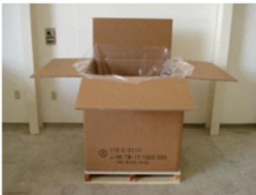
箱の中に内袋と製品を入れる 内袋の口を閉める